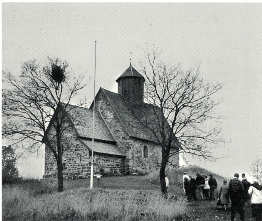
Tingelstad gamle kirke

Nr. 4 1997 Årgang 15 Pris kr. 40,- ISSN: 0802-860